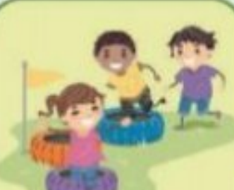
Yoga & PE

Take quick bends, Draw lines with a ruler, Table Pose, Mermaid Pose