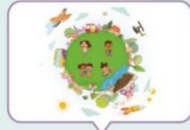
Transport and Communication