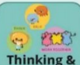
Thinking & Socio-Emotional Skills

Use a hammer, Put beans in a bottle, Thread shoelaces, Anapana, Recap all asanas